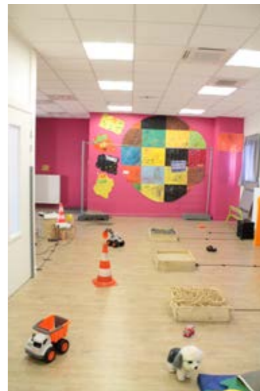
Centre d'initiation à l'art Mille formes:

Création et scénographie des modules des ateliers :