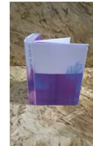
SUR LES NERVURES DE LA PHALÈNE BRUMEUSE , 2015, Dispositif sonore et édition limitée de 50 cassettes audio