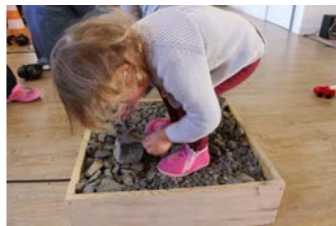
vues des ateliers