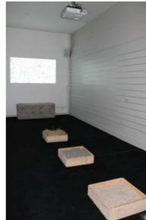
jardin Lecoq, Clermont ferrand